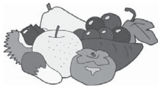
YAHOO! ニュース 2020年9月2日

「すぐ火葬してしまうから、誰にも会わないからどうでもいいというわけではない。保冷処置を施すことで状態を保つことができ尊厳を守ることでもできる。私たちが適切に感染予防対策をすることで遺族に十分なお別れの場を提供することもできる。そういった取り組みをぜひ多くの葬祭業者に伝えていきたい」と、三村さんはこの数か月間の激闘を振り返りながら語った。(吉川美津子 終活・葬送系の社会福祉士)