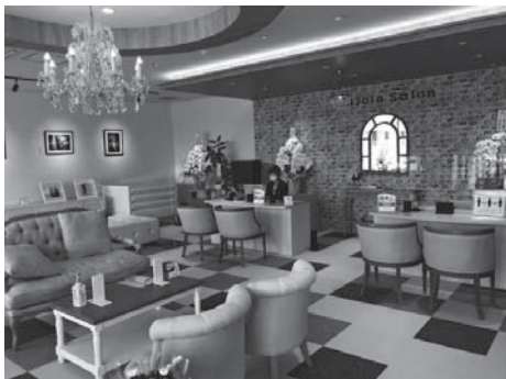
葬儀だけでなくシニアライフ全般を支えるエンジョインサロン (山形市)

コンビニ跡の建物を2000万円かけて改修。美容師が顔のしわを目立たなくするメイクを施しカメラマンが撮影する「奇跡の1枚」や、ワンコインで撮影できる終活写真コーナーを設置した。専用ルームでは絵